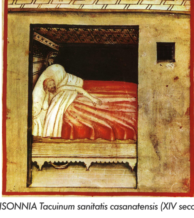
INSONNIA Tacuinum sanitatis casanatensis (XIV secolo)